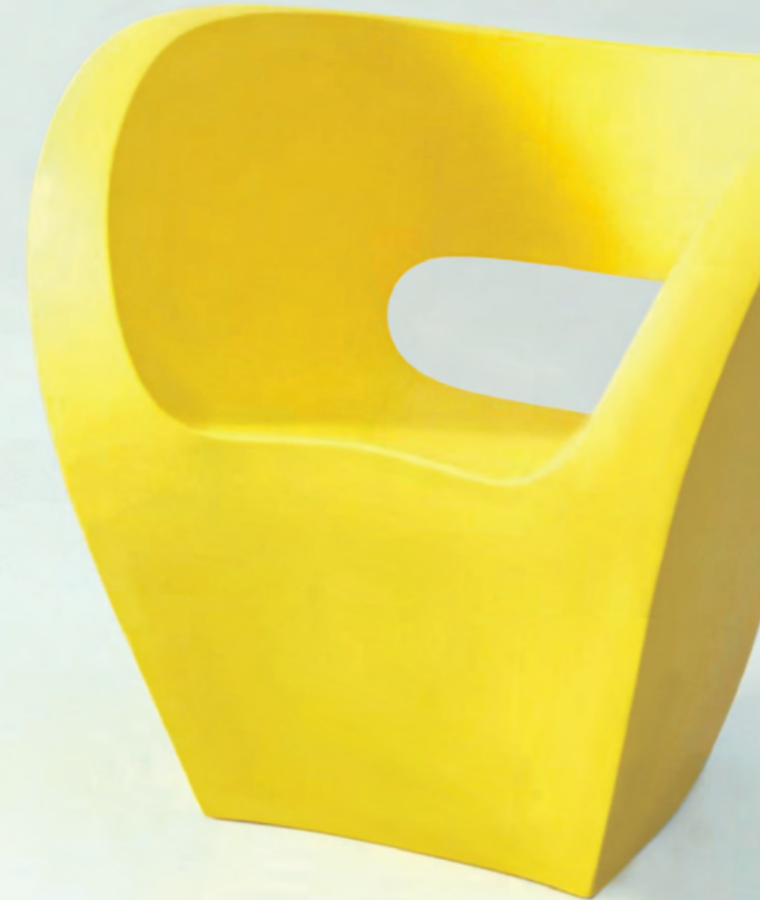
Phyllida Barlow, untitled: balcony , 2010